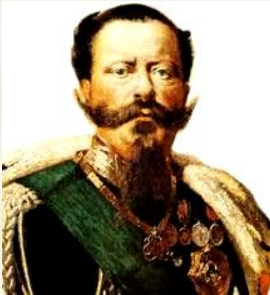
Victor Manuel de Saboya