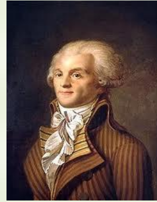
Maximilien de Robespierre