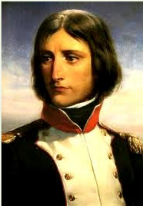
Un joven general llamado Napoleón Bonaparte.