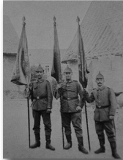
Soldados alemanes en 1914

REALIZA, CON LA PLANTILLA DE CLASE, EL COMENTARIO DE TEXTO LEÍDO ANTERIORMENTE