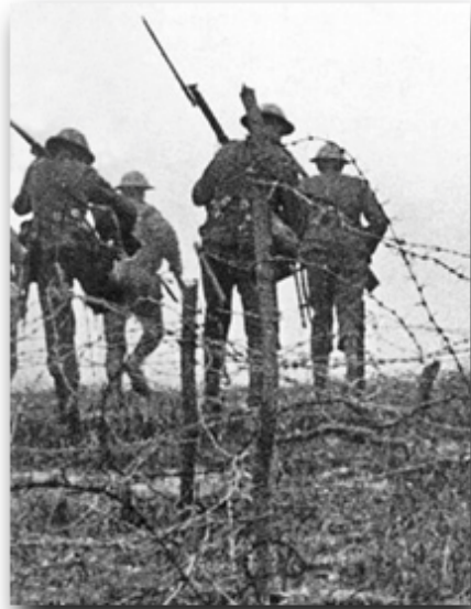
Soldados británicos avanzando en la batalla del Somme

Eric Hobsbawn; Historia del Siglo XX; 1995, Crítica