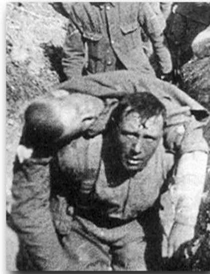
Soldado británico recogiendo a un compañero herido en la batalla del Somme