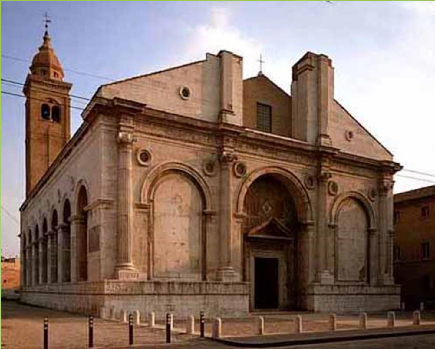
LEÓN BATTISTA ALBERTI (1404-1472) Templo Malatestiano