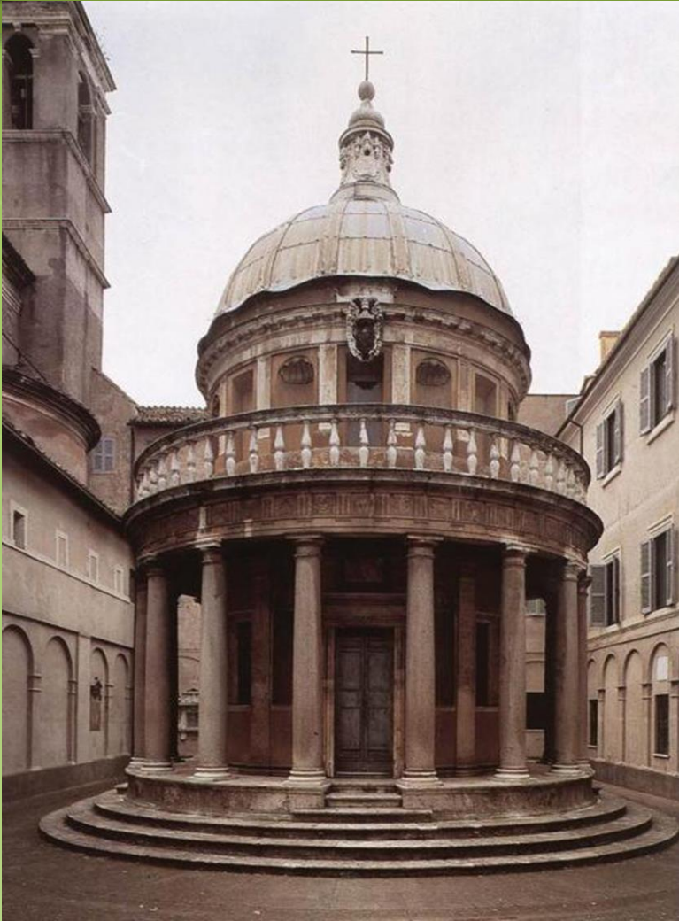
BRAMANTE San Pietro in Montorio