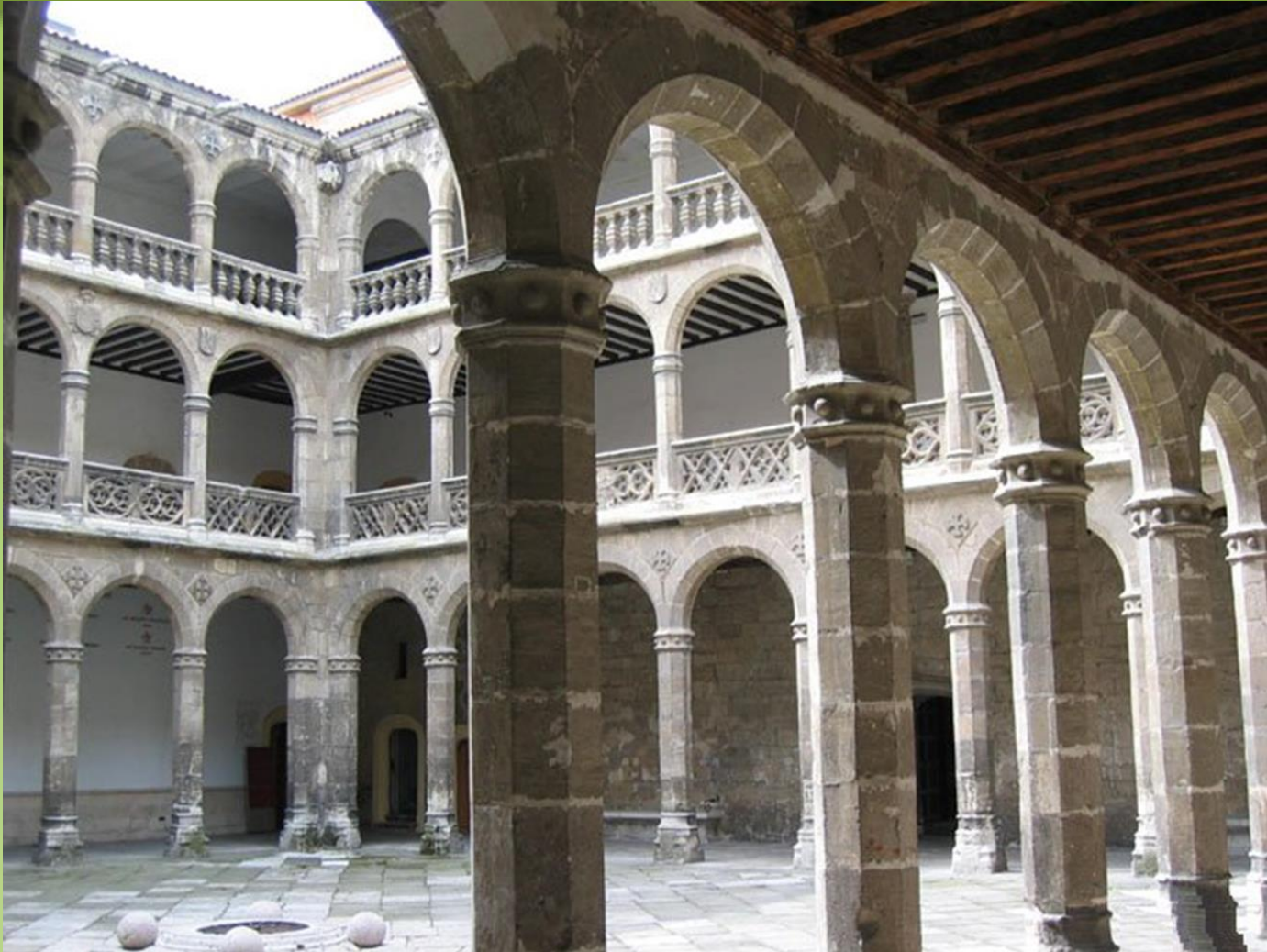
Colegio Santa Cruz Valladolid 1479