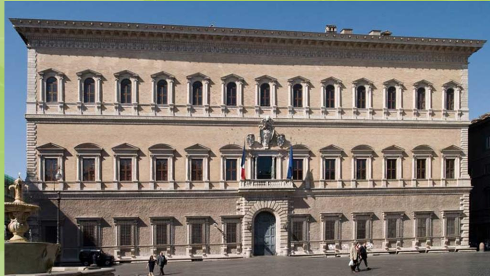
MIGUEL ÁNGEL y ANTONIO DA SANGALLO Palacio Farnese, Roma