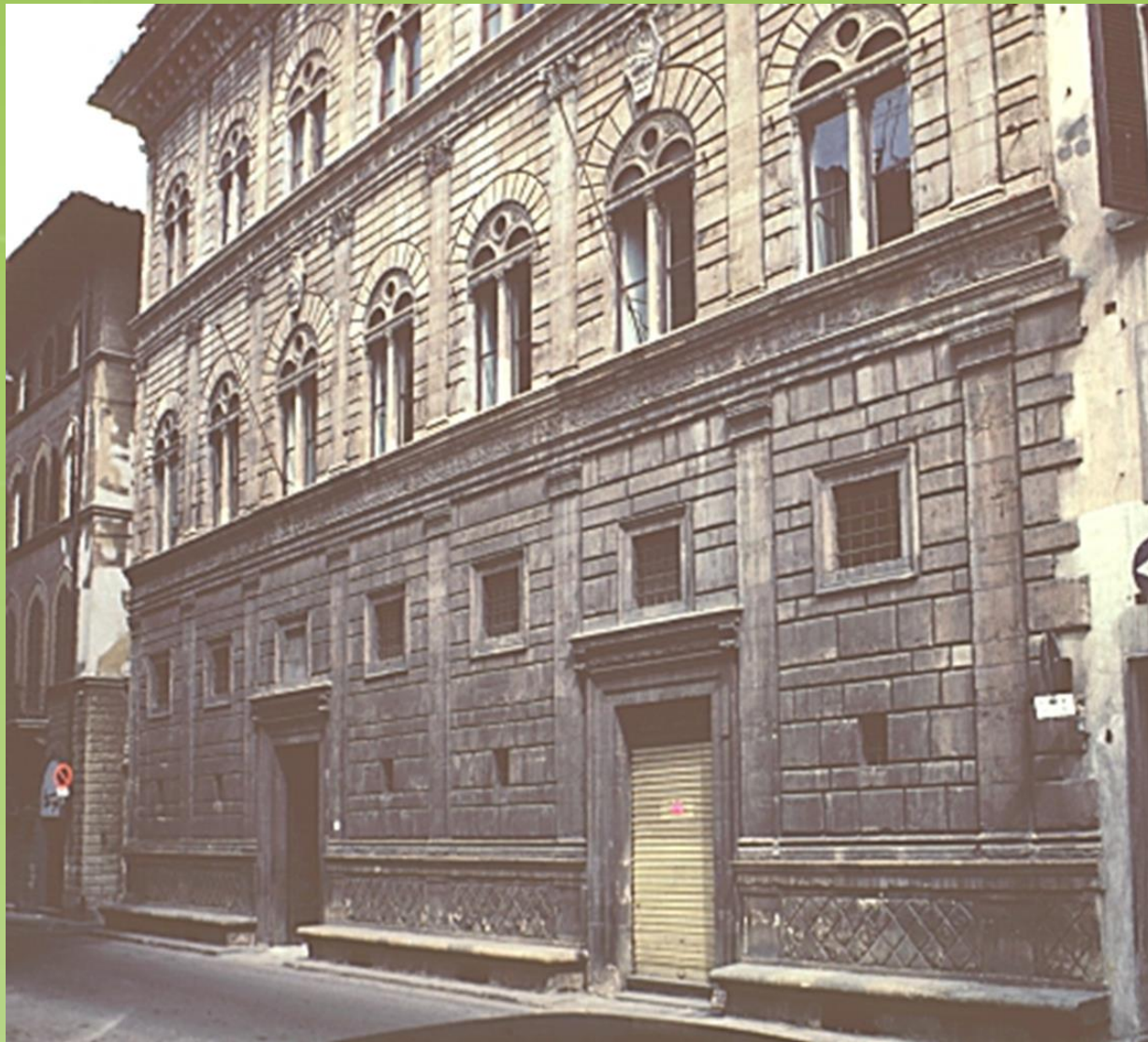
LEÓN BATTISTA ALBERTI (1404-1472) Palacio Rucellai.