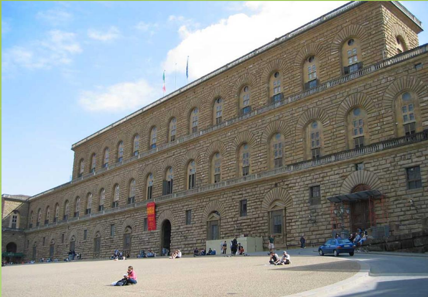
FILIPPO BRUNELLESCHI (1377-1466) Palacio Pitti,