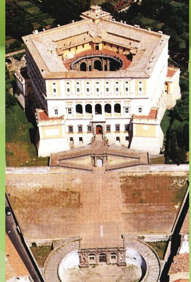
VIGNOLA: Villa Farnese en Caprarola