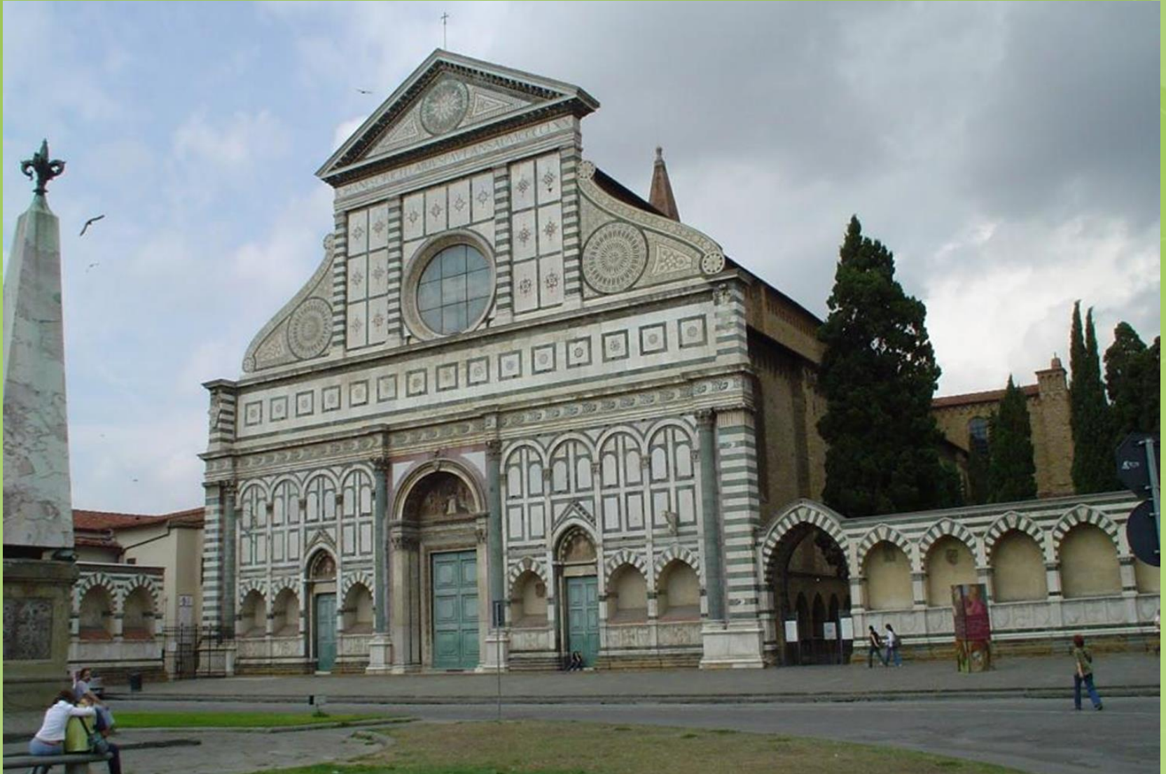
LEON BATTISTA ALBERTI Fachada de Santa María Novella, Florencia